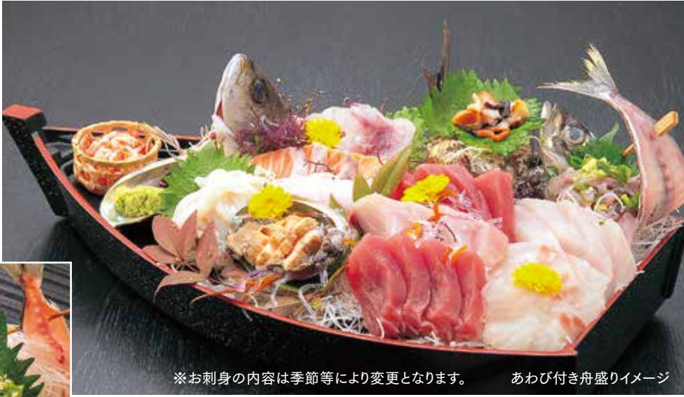
※お刺身の内容は季節等により変更となります。 あわび付き舟盛りイメージ